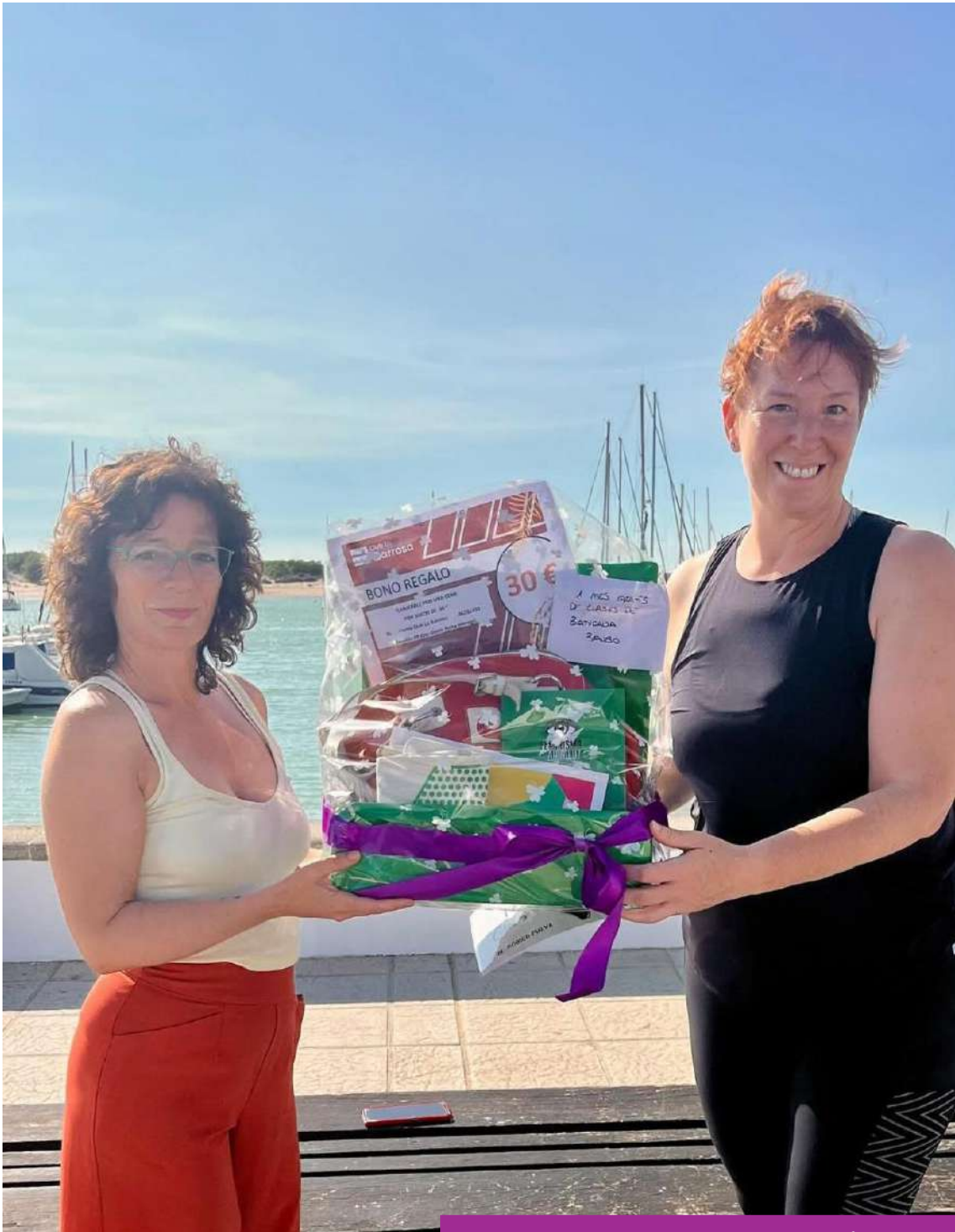
Entrega de la cesta a la premiada