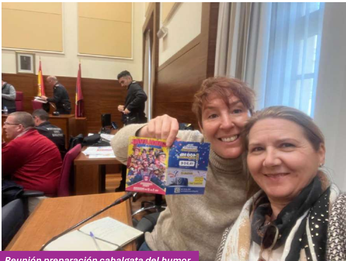
Reunión preparación cabalgata del humor

Quisimos participar en la Cabalgata del Humor de Chiclana, convencidas de que el feminismo y el carnaval pueden convivir y enriquecerse mutuamente. Consideramos que la cultura popular gaditana constituye una herramienta poderosa para denunciar desigualdades, cuestionar estereotipos y visibilizar las reivindicaciones de las mujeres desde la creatividad, el humor y la crítica social.